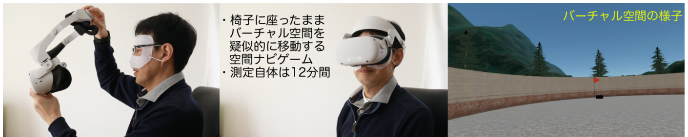
画像 1 VR ゴーグルを用いた高島式アルツハイマー病超早期スクリーニング検査

驚くことにアルツハイマー病の「最初期」段階である嗅内野での脳神経細胞の破壊が始まっている方(Braak Stage I)は 40 代でも約 50%近くいます。しかし自覚症状が全くない上に、既存の検査方法では「健常者」と判定されるために、知らない内にそのまま進行しているのが現状です。発症リスク低減活動(予防活動)も最初期から始めると高い効果が期待できることが世界中で実施された疫学的研究からも分かっています。(画像 3)