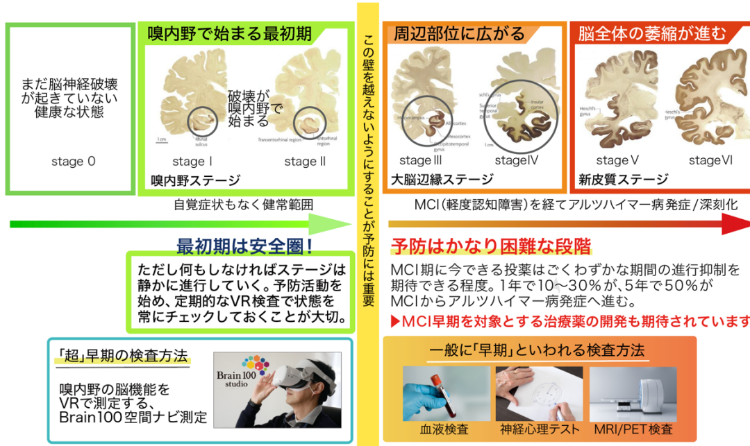
画像 3 アルツハイマー病の進行と「超早期」検査の関係